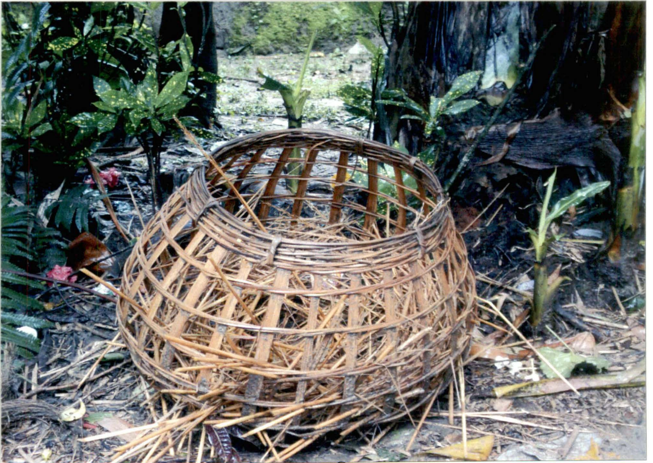
মুরগি রাখার স্থান, চিত্র নং - ১৪