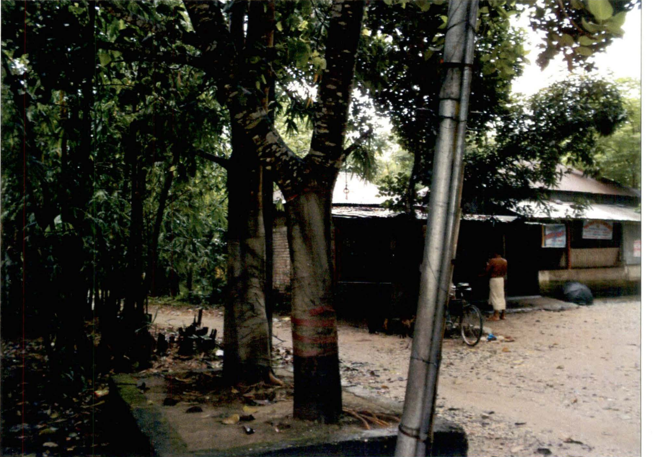
বট-পাখিড়ির বিয়াও - শালবাড়ি, ধূপগুড়ি - চিত্র নং - ৬