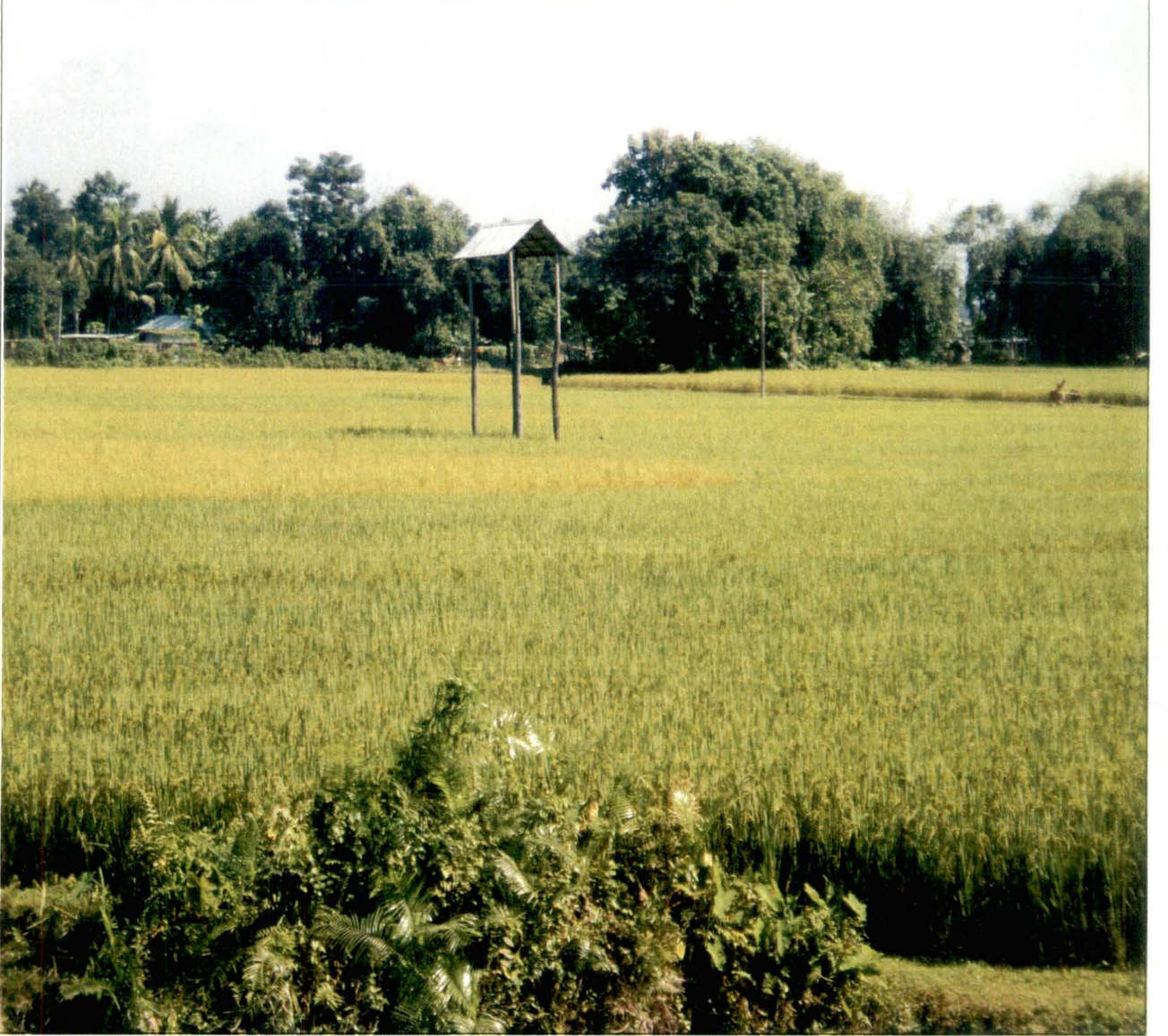
টং - সোনাখালি, ধূপগুড়ি - চিত্র নং - ১৯