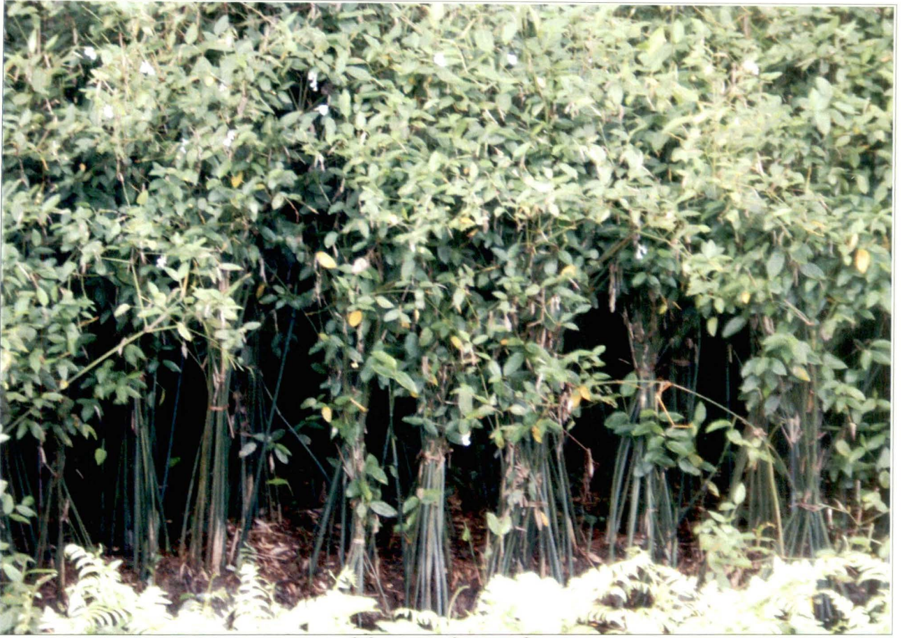
বেতঝাড় - নিশিগঞ্জ, কুচবিহার - চিত্র নং - ১৭