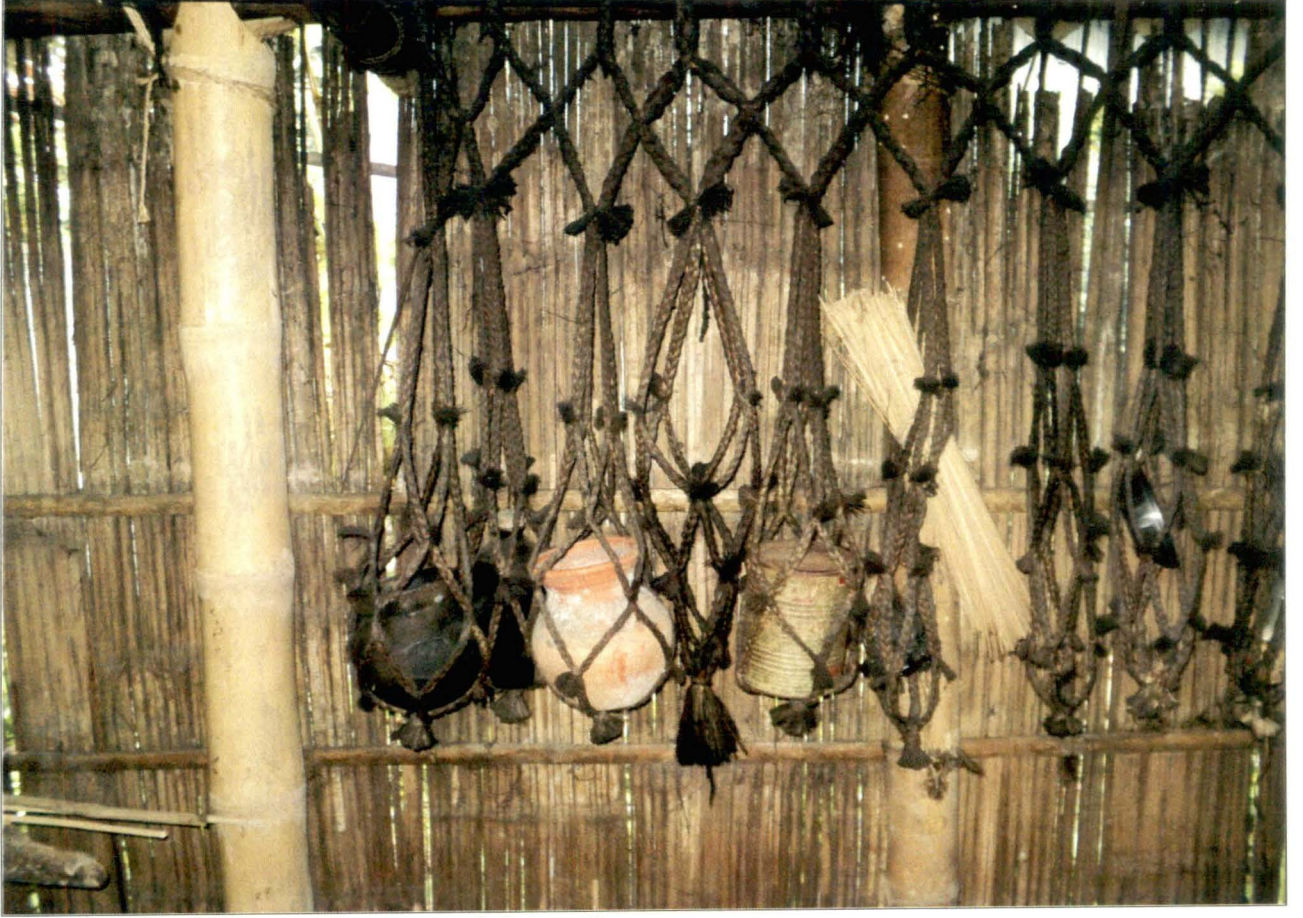
শিকিয়া - চিত্র নং - ১১