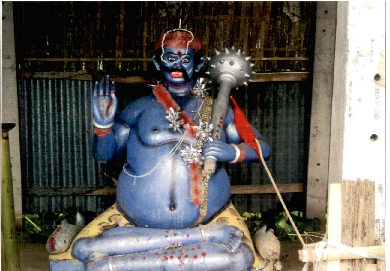
মাশান, মাথাভাঙ্গা, কুচবিহার - চিত্র নং - ৪