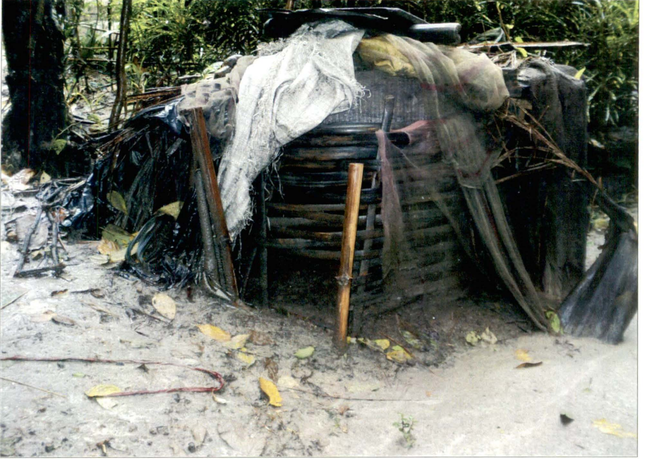
ইস রাখার স্থান, চিত্র নং - ১৩