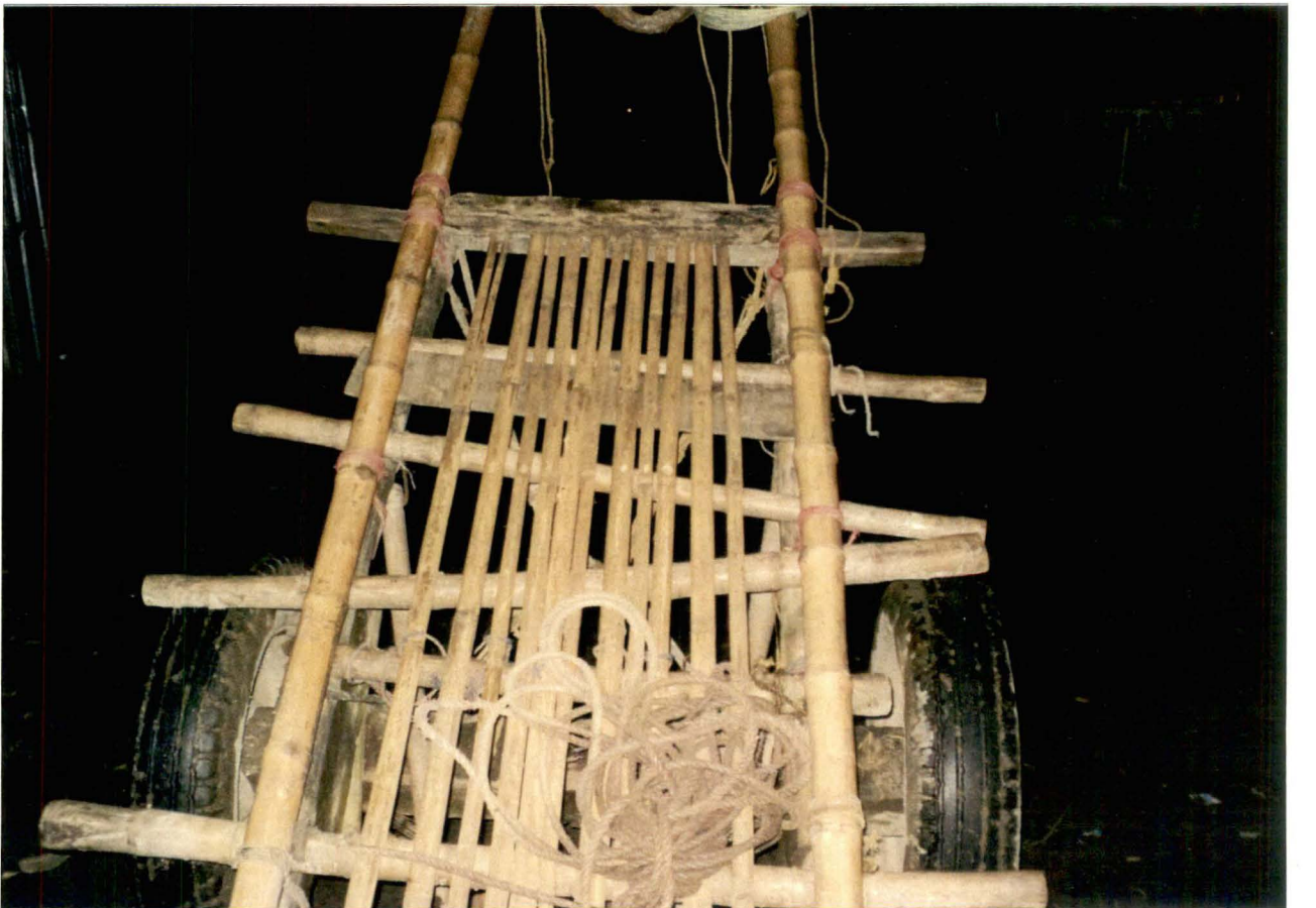
ঘোড়ার গাড়ি, হিন্দুস্তান মোড়, কুচবিহার - চিত্র নং - ১০