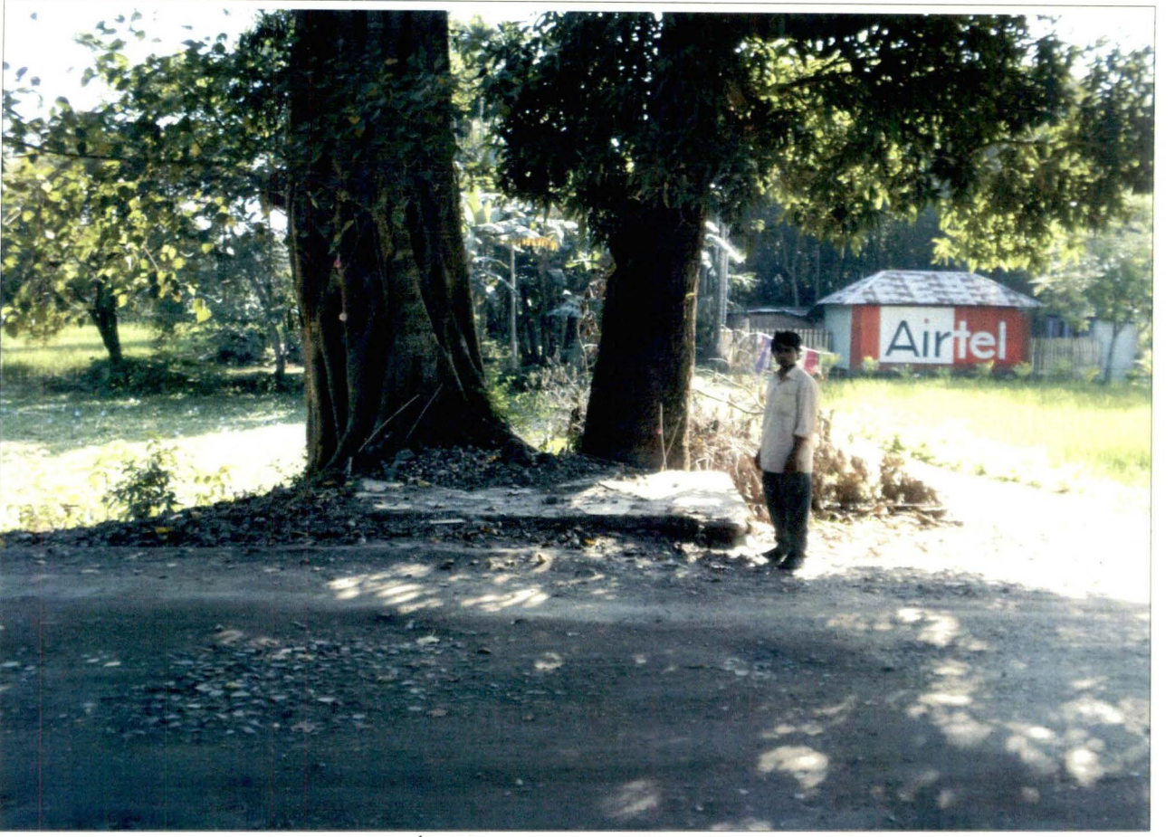
ঢালখাওয়া ঠাকুর - দমদমা, ধূপগুড়ি - চিত্র নং - ৫