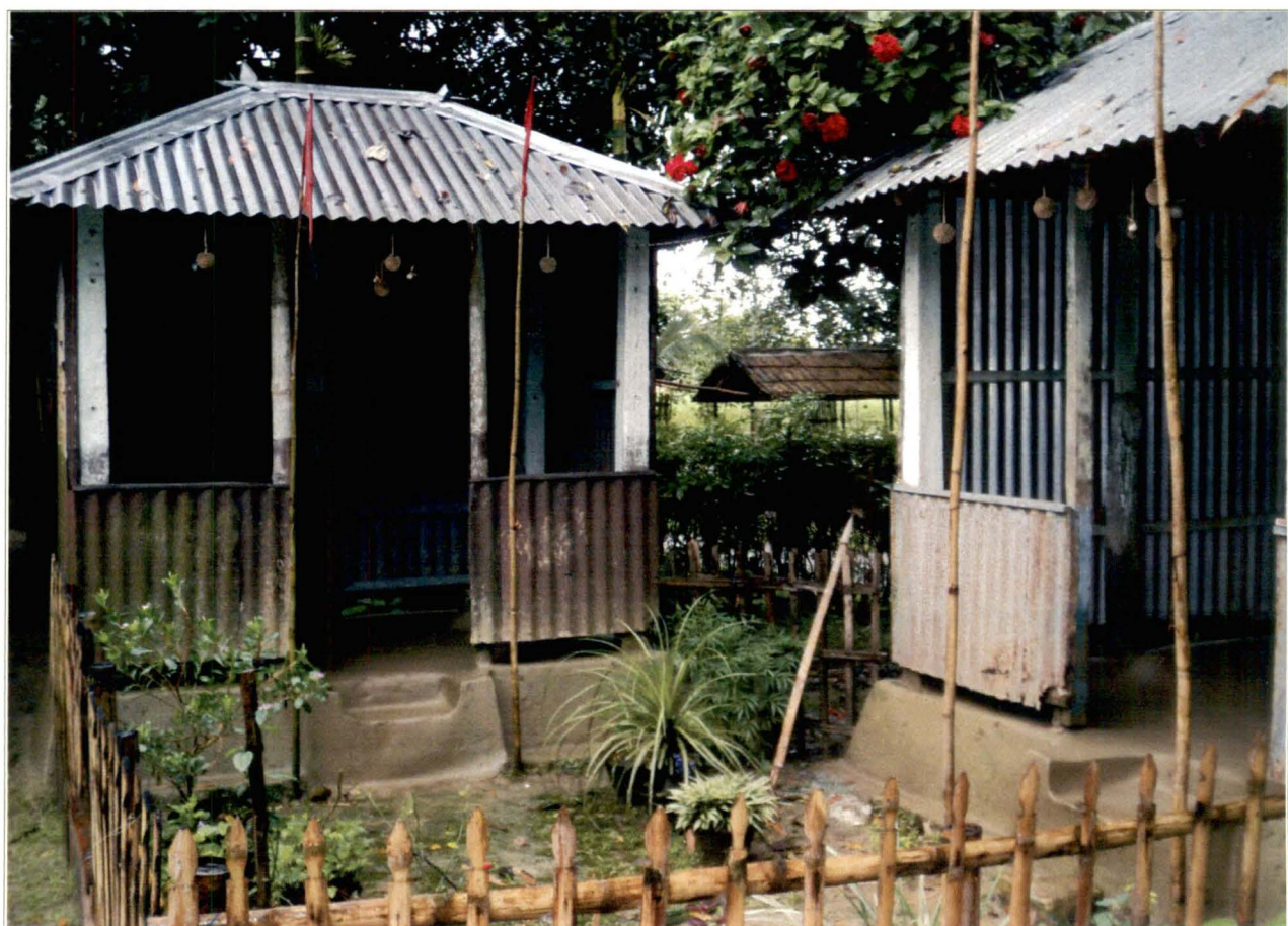
ঠাকুর থান, ধূপগুড়ি - চিত্র নং - ৮