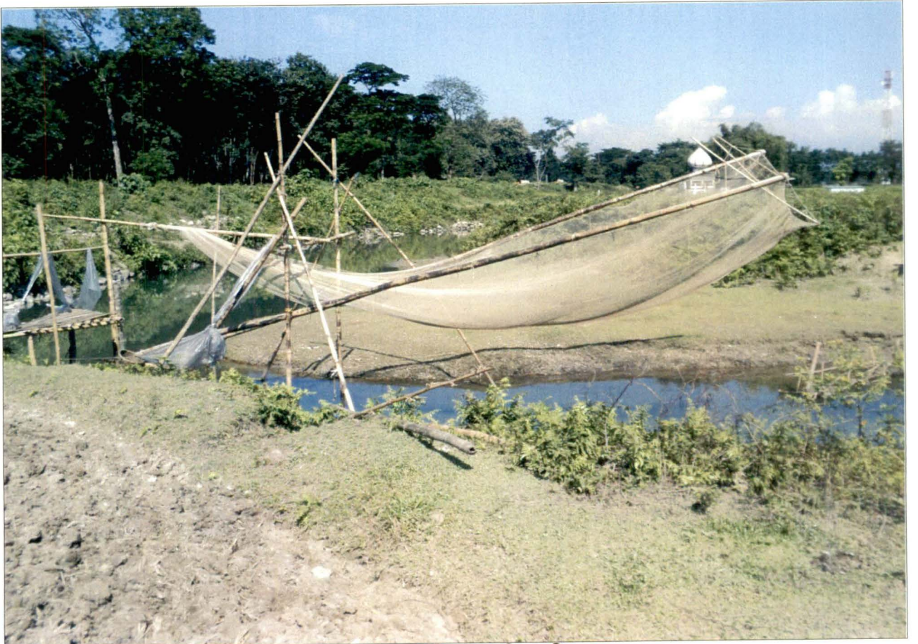
খরা জাল - সোনাখালি, ধুপগুড়ি - চিত্র নং - ১২