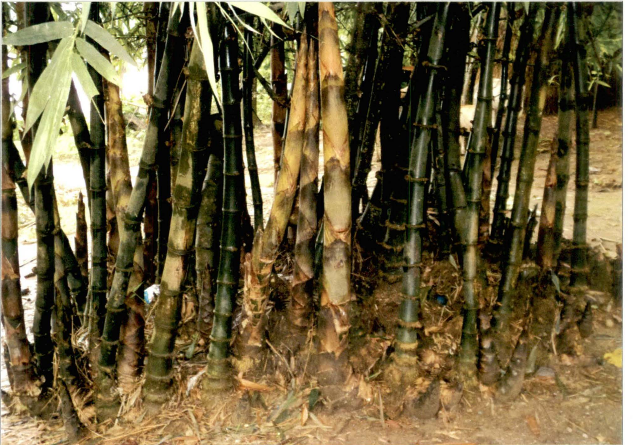
বঁশ ও করুল, শালবাড়ি, জলপাইগুড়ি - চিত্র নং - ১৮