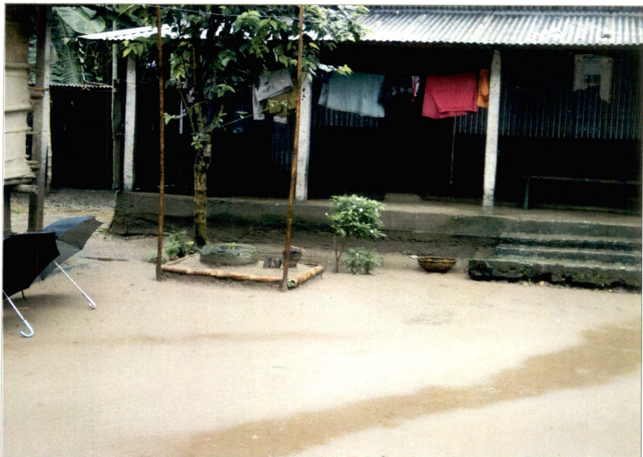
থানশ্রী - পূর্বশালবাড়ি, জলপাইগুড়ি - চিত্র নং - ৭