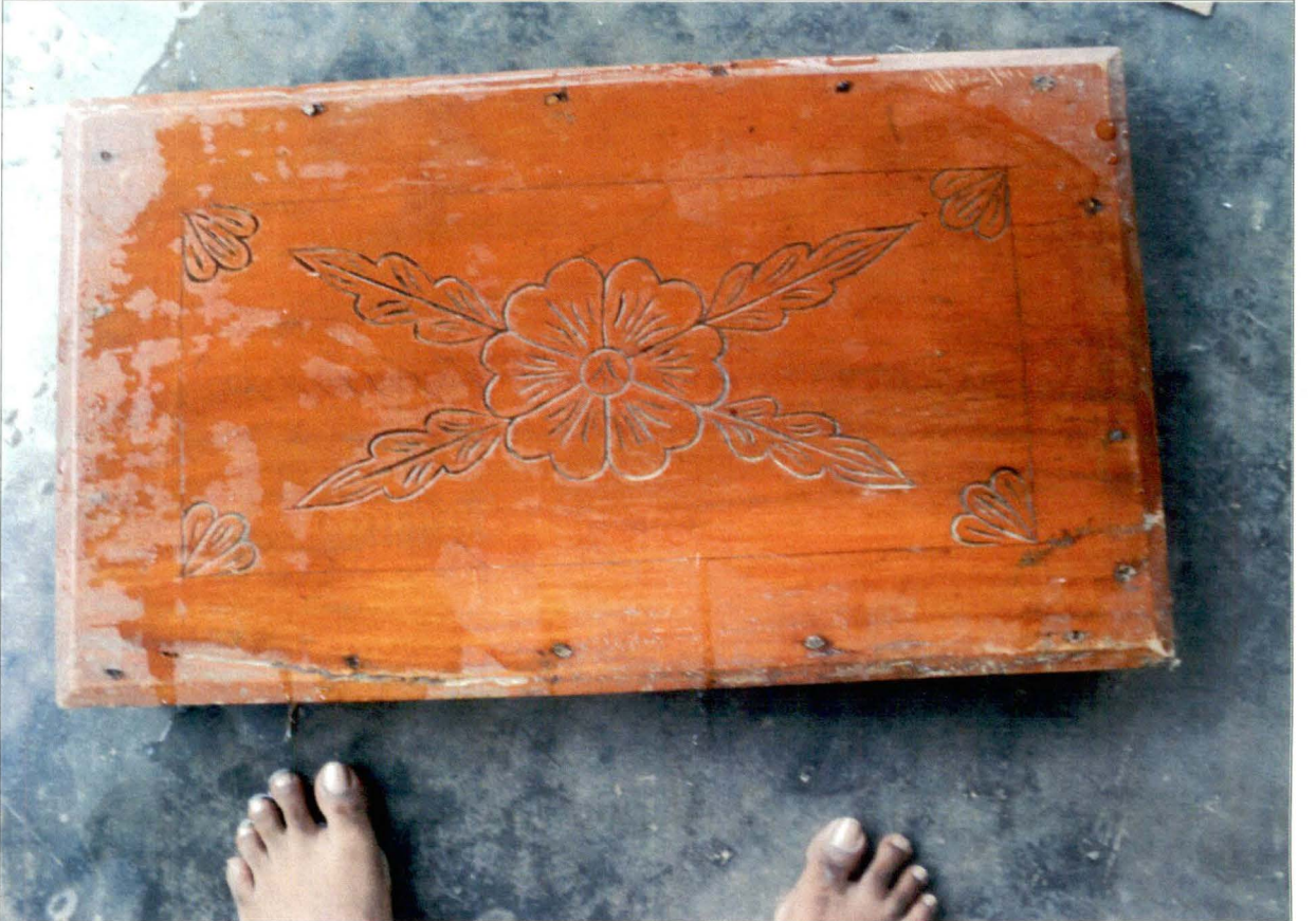
পিঁড়ি আলপনা - চিত্র নং - ২