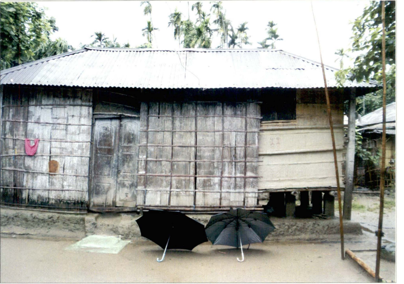
ভান্ডারঘর, পূর্বশালবাড়ি, শালবাড়ি, - চিত্র নং - ৯