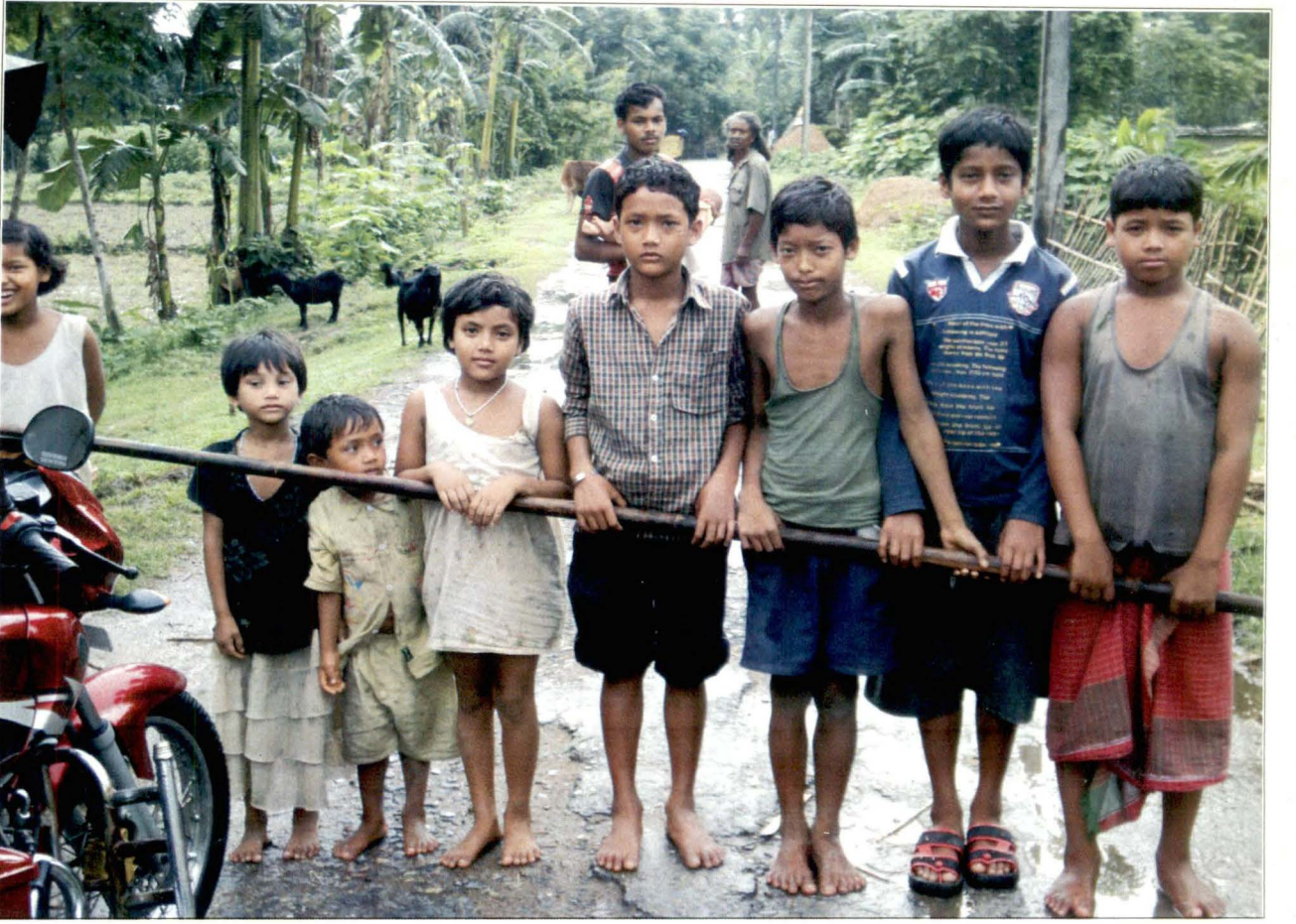
আমাতি পূজা - দোলৎমোর, মাথাভাঙ্গা, কুচবিহার - চিত্র নং - ১৫